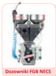
Dozowniki FGB NECS