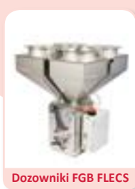
Dozowniki FGB FLECS