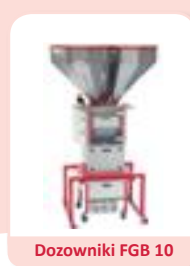
Dozowniki FGB 10