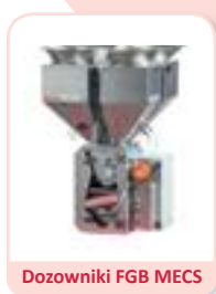
Dozowniki FGB MECS