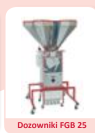
Dozowniki FGB 25