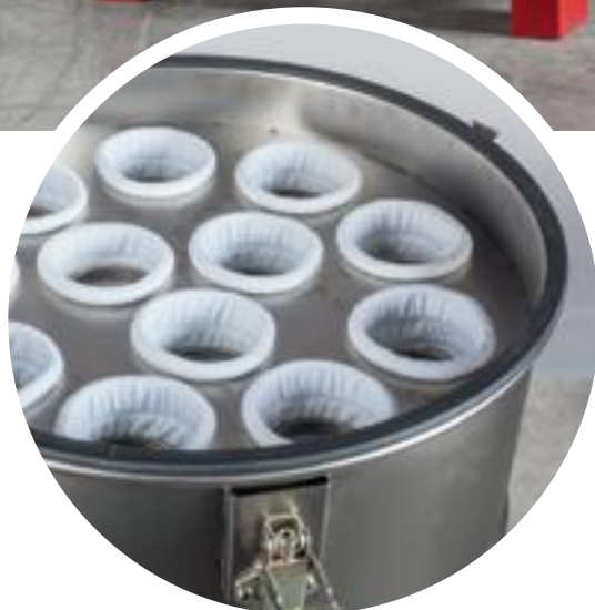
Filtr centralny CF500