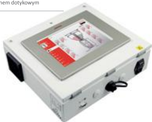
Panel sterowania z ekranem dotykowym

Możliwość dozowania już od 1,5g czyli nawet 0,1% dodatku! System waży z dokładnością 1/100 grama. W zależności od oprogramowania wyświetlacz pokazuje wagę każdego komponentu z dokładnością co do 1 grama lub 1/10 grama.