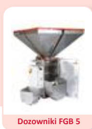
Dozowniki FGB 5