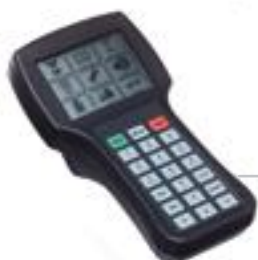
Przenośny panel sterowania